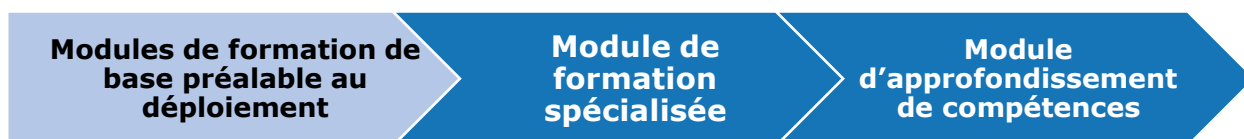
Diagramme 6 : Exigences obligatoires et recommandées de l'ONU en matière de formation au maintien de la paix

Les MFBPD sont universels et présentent les connaissances essentielles pour tout personnel de maintien de la paix (militaire, civil et police) avant le déploiement. Ces modules incluent la formation sur la conduite et la discipline et la prévention de l'exploitation et des abus sexuels. Les MFBPD s'appliquent à toutes les fonctions, catégories et grades. Les MFBPD établissent également des exigences minimales en matière de processus pour dispenser une formation préalable au déploiement conforme aux normes de l'ONU.