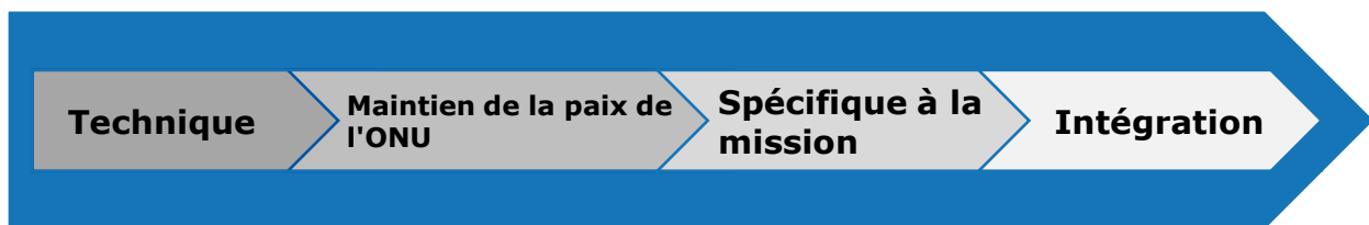
Diagramme 5 : Étapes au cours des phases de la formation préalable au déploiement

La responsabilité nationale et de l'ONU pour la formation préalable au déploiement couvre quatre étapes importantes.