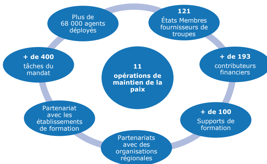
Diagramme 3 : Formation – Un défi d'envergure

L'ampleur et la diversité des acteurs qui ont besoin d'un appui posent un défi à la formation au maintien de la paix de l'ONU.