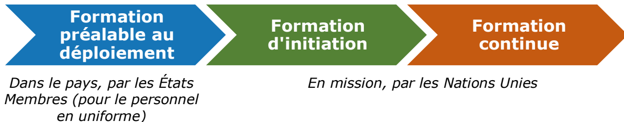
Diagramme 4 : Les phases de la formation au maintien de la paix

La formation au maintien de la paix comporte trois phases. Le lieu et l'entité responsable de cette formation diffèrent selon les phases. Les normes définissent ce que les apprenants doivent apprendre et ce que les formateurs doivent enseigner.